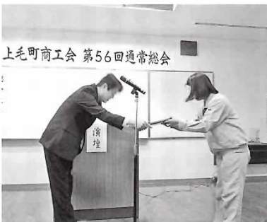
上毛町商工会 第56回通常総会