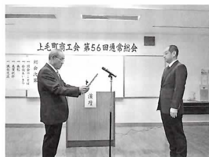
上毛町商工会 第56回通常総会