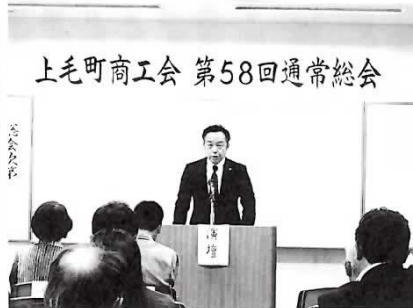
上毛町商工会 第58回通常総会