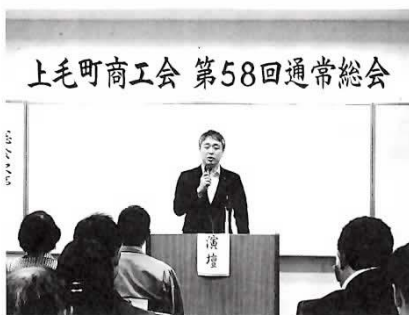
上毛町商工会 第58回通常総会